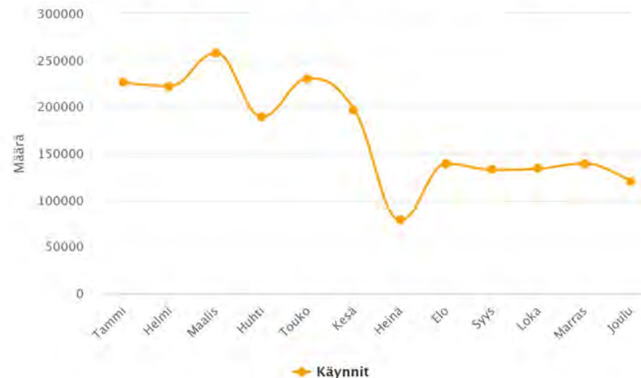
Käynnit kt.fi-verkkosivustolla vuonna 2023

Monikanavaisella ja aktiivisella viestinnällä tuotiin esille KT:n tavoitteita ja näkemyksiä edunvalvontatyön tueksi. Yhteistyötä tavoitteiden näkyviin tuomiseksi tehtiin eri sidosryhmien, kuten keskusjärjestöjen ja eri asiakasryhmiemme edustajien, kanssa.