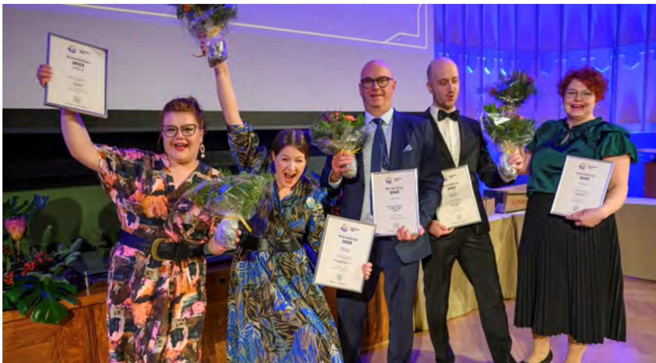
Liminka valittiin Suomen kekseliäimmäksi kunnaksi Tärkeissä töissä -gaalassa.

Henkilöstöjohtamista ja esihenkilötyötä tuettiin myös kuntaperheen Kuntayt5:n yhteisillä kehittämishankkeilla. Kuntayt5:ssä ovat mukana KT, Kuntaliitto, Avainta, Keva ja Kuntarahoitus.