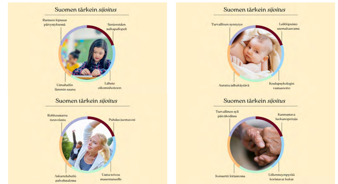
Kuva 1. Julkinen työ saattaa olla tai on Suomen tärkein sijoitus 1 .

Tämän raportin tiedot perustuvat aiheeseen liittyviin tutkimuksiin, artikkeleihin ja työn murroksen seurannan tuloksiin kunta- ja hyvinvointialalla.